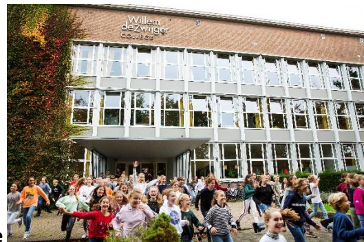
Willem de Zwijger College